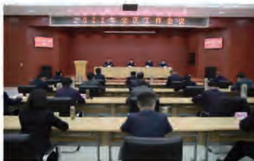
(图一：黄三角农高区召开2022年经济工作会议)