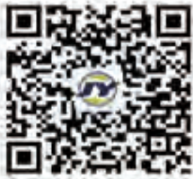
集团公司 公众微信账号

下一步将保持货币信贷合理增长。密切关注国内外经济金融形势边际变化，加强对财政收支、政府债券发行、现金投放回笼和主要经济体货币政策调整等不确定因素的监测分析，综合运用多种货币政策工具保持流动性合理充裕，引导市场利率围绕政策利率为中枢上下波动。完善货币供应调控机制，持续缓解银行信贷供给的流动性、资本和利率三大约束，培育和激发实体经济信贷需求，引导金融机构有力扩大信贷投放，增强信贷总量增长的稳定性，保持货币供应量和社融融资规模增速同名义经济增速基本匹配。健全可持续发展的资本补充机制，多渠道补充商业银行资本，加大对中小银行发行永续债等资本补充工具的支持力度，提升银行服务实体经济和防范化解金融风险的能力。